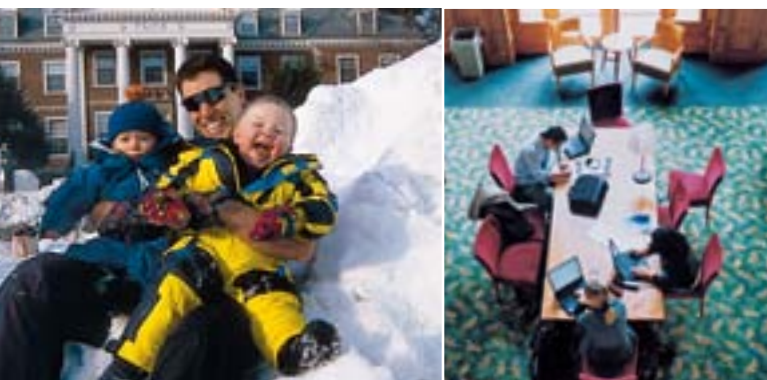
Tuckウィンターカーニバルの様子

Tuckのキャリア開発についてのさらなる情報は www.tuck.dartmouth.edu/careers をご覧ください。