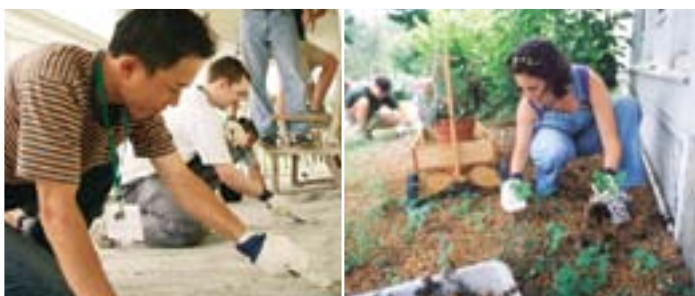
Allwin Initiative の奉仕活動デーに参加する学生たち

Center for Private Equity and Entrepreneurship では、プライベートエクイティによる投資やベンチャー企業についての理解向上を主眼においています。急成長中の企業やプライベートエクイティ業界のみに留まらず、起業家、プライベートエクイティ業界の関係者と金融市場の相互関係についても焦点を当てています。その使命はプライベートエクイティとアントレプレナーシップについての信頼できる、独立した情報源となることです。つまり、起業家とプライベートエクイティ業界、金融機関の間の相互理解の橋渡しとなり、ハイクオリティな教材やプログラムをより多くの人に広く提供することを目標としています。