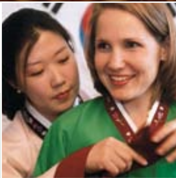
日本/韓国カルチャーナイトの様子