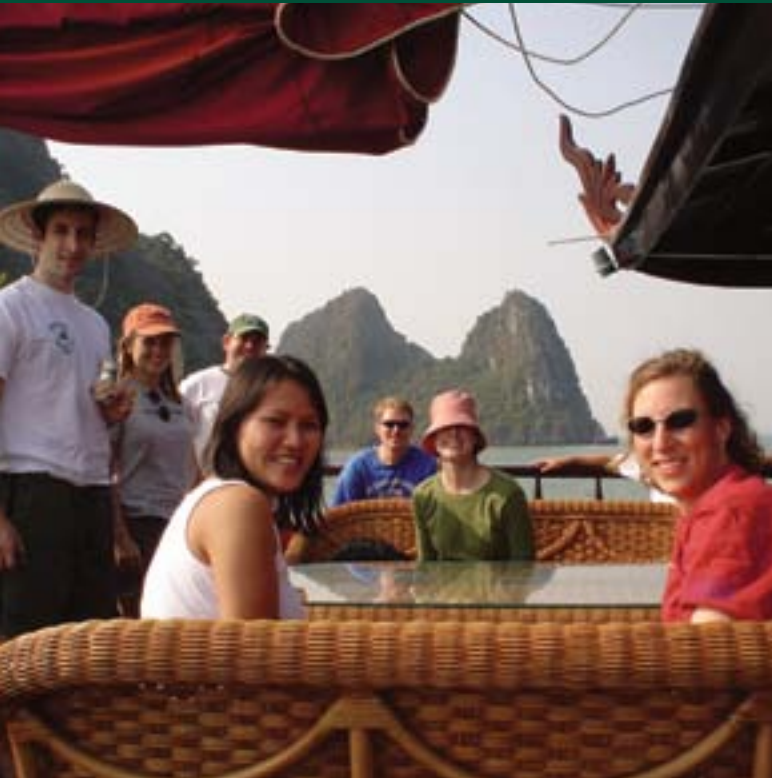
Tuckグローバルコンサルタンシー、 ベトナムにて