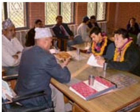
ネパールでのTuckグローバルコンサルタンシープロジェクトの様子